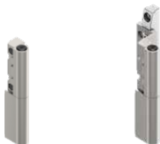
dvoudílné válcové závěsy 218 P a 222 P