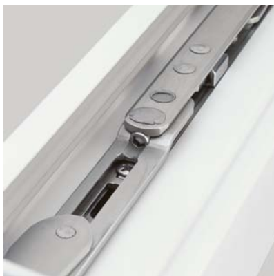
Zvenku neviditelný Všechny díly jsou integrovány do rámu okna a křídla