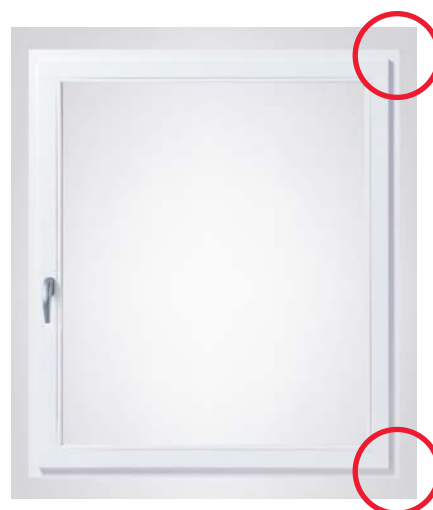
Okno s Roto NT Designo a zcela skryté závěsy