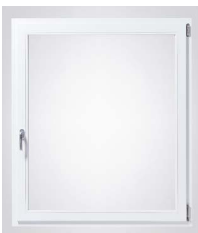
Konvenční okno s viditelnými závěsy

Kombinace s podlahovým prahem Roto Eifel TB, který umožňuje bezbariérový přístup na balkon a terasu, nabízí také větší komfort pro balkónové dveře.