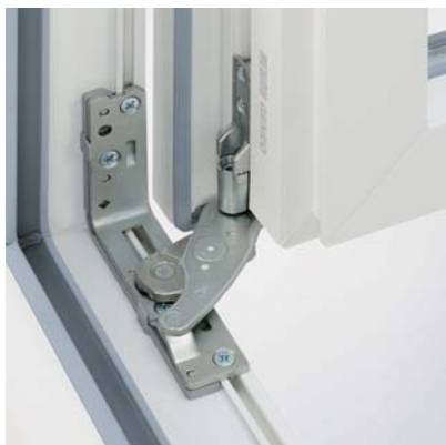
Jednoduché nastavení okenního křídla Okenní křídla lze nastavit trojrozměrně pomocí seřizovacích šroubů

Kompletní závěsová strana je montována skrytě. Všechna nastavení lze provést pouze jedním 4 mm imbusovým klíčem, rezervy seřízení jsou opticky viditelné pomocí stupnice na křídlovém závěsu. Nové, v zabudovaném stavu neviditelné prvky na odvod zatížení, se skládají z malých kompaktních konstrukčních dílů. Výhoda: krátké montážní a kovací časy.