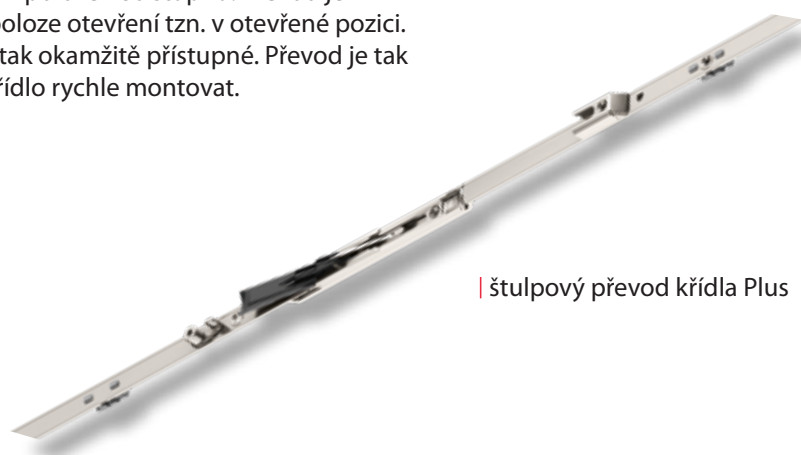
| štulpový převod křídla Plus

Páka nového štulpového převodu Roto NX Plus se v poloze otevření nachází téměř v poloze 180 stupňů. Převod je dodáván právě v této poloze otevření tzn. v otevřené pozici. Upevňovací vruty jsou tak okamžitě přístupné. Převod je tak možné rychle zkrátit, křídlo rychle montovat.