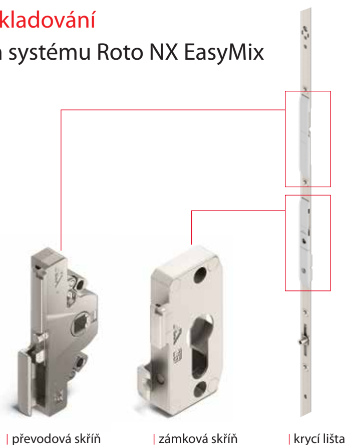
| převodová skříň

Systém EasyMix prezentuje krycí lišty a skříň převodu, příp. zámku, které je možné do sebe zasadit a dosáhnout tak pevného spojení, aniž by bylo nutné použít šroubové spojení.