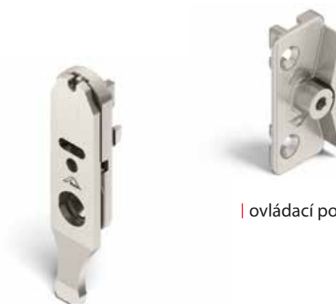
| ovládací pojistka - rámový díl