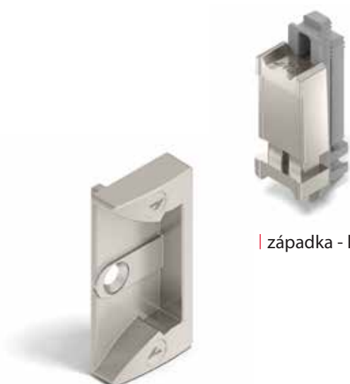
| západka - křídlový díl

Spolehlivé a na údržbu nenáročné řešení pak přináší nové provedení Roto NX balkónové západky. Pracující se stabilní a spolehlivou pružinovou konstrukcí. Západka díky svému tvaru přesvědčí optimálními náběhovými vlastnostmi a vysokou přídržnou silou, která přispívá ke komfortu obsluhy. Snazší montáž pak zajišťuje výšková kompenzace u křídlového dílu o velikosti 7 mm. Rámový a křídlový díl je tak možné jeden k druhému patřičně přizpůsobit.