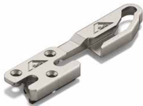
bezpečnostní rámový uzávěr pro sklopné větrání

Okno, vybavené kováním Roto NX TiltSafe s inovovanými bezpečnostními komponenty Roto NX, nabízí během větrání sklopením vysokou bezpečnost proti vloupání. Ochrana proti vloupání RC 2 v poloze sklopení je nyní realizována pouze třemi Roto NX bezpečnostními rámovými uzávěry pro sklopné větrání v kombinaci s bezpečnostními uzavíracími čepy Roto a uzamykatelnou klikou. Díky vzdálenosti sklopení až 65 mm dosáhnou majitelé oken s kováním Roto NX TiltSafe zároveň vysoké výměny vzduchu resp. více bytového komfortu. A to s dobrým pocitem lepší ochrany před nezvanými hosty.