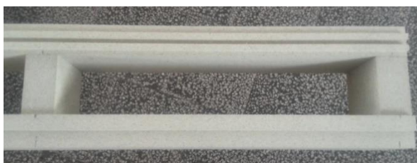
Purenit “žebřík” z Purenitu 30 mm (lze i z 50 mm a 60 mm)