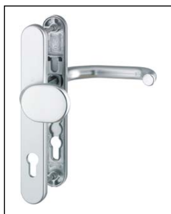
PARIS F 1 pro šířku křídla 67-72 mm