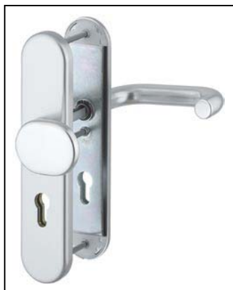
PARIS F 1 pro šířku křídla 67-72 mm